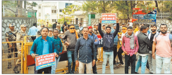
खदान में काम रोकवाते एवं प्रदर्शन करते भूविस्थापित।