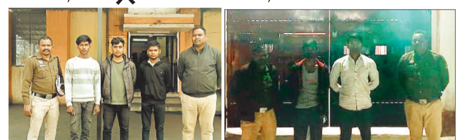
पुलिस गिरफ्त में आरोपी।

कोयले की अफरी तफरी करने के मामले में दीपका पुलिस ने महत्वपूर्ण सफलता हासिल की है। इस गिरोह में शामिल 6 ट्रैलर वाहन