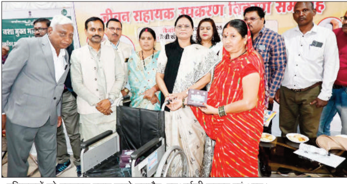
वरिष्ठजनों को उपकरण प्रदान करते महापौर, एमआईसी सदस्य एवं अन्य।

वरिष्ठजनों की सेवा सुश्रुषा करना एवं उन्हें सम्मान देना हमारी भारतीय संस्कृति का सबसे महत्वपूर्ण अंग है और हमारा परम कर्तव्य भी है, हमारे वरिष्ठजनों के जीवन अनुभव एवं उनके मार्गदर्शन हमारी जीवन यात्रा को सही दिशा देते हैं, सही और गलत का भेद समझाते हैं। हमारा परम दायित्व है कि हम समाज के वरिष्ठजनों का सम्मान करें, उनकी सेवा करें तथा उनका आशीर्वाद प्राप्त करें।