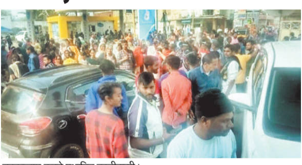
चक्काजाम करते प्रभावित बस्तीवासी।

औद्योगिक नगरी में दशकों से बसे इंदिरा नगर के निवासियों पर बेखुली का काला साया मंडरा रहा है। रेलवे प्रशासन द्वारा करीब 250