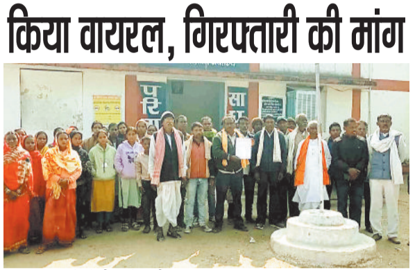
शिकायत करने चौकी पहुंचे ग्रामीण।