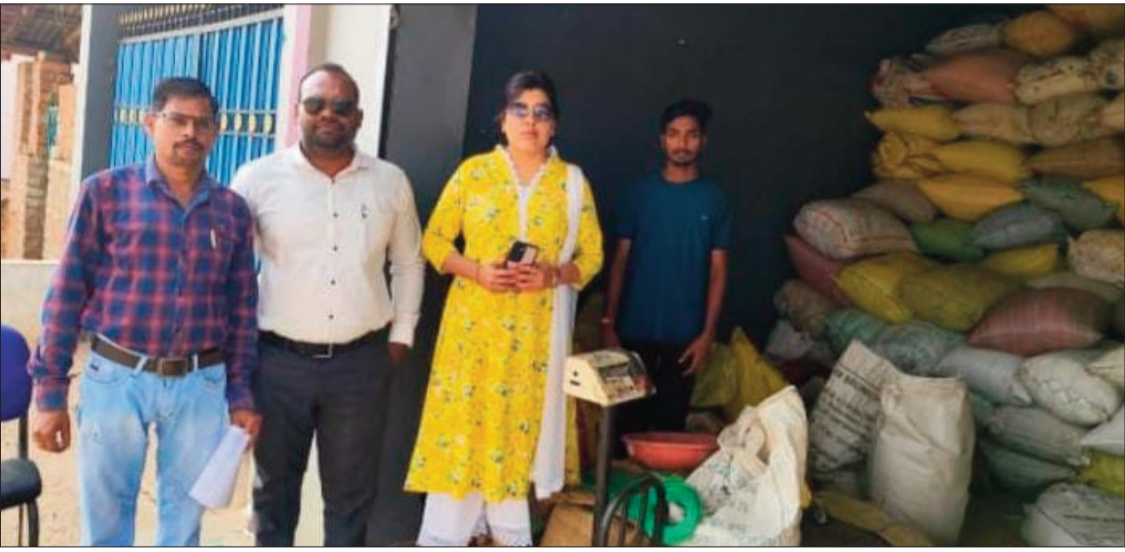
कार्रवाई दौरान उपस्थित जांच टीम के सदस्य।