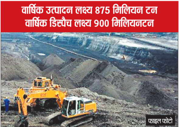
वार्षिक उत्पादन लक्ष्य 875 मिलियन टन वार्षिक डिस्पैच लक्ष्य 900 मिलियन टन

में कोल इंडिया उत्पादन लक्ष्य को हासिल करने के लिए जूझ रहा है। कैप्टिव कमर्शियल माइनिंग से कोयला बिक्री प्रभावित हो रहा है। गत वित्तीय वर्ष कैप्टिव कमर्शियल माइनिंग से 197 एमटी उत्पादन हुआ। कोल इंडिया कोयले का सबसे बड़ा खरीददार एनटीपीसी ने स्वयं 40 एमटी उत्पादन किया। कोल इंडिया की 4 यूनिट्स 4 लेबर कोड के विरोध में एक यूनिट्स समर्थन जताने में व्यस्त हैं। श्रमिक संगठन बीएमएस का हाल ही में 3 दिवसीय कार्यशाला नागपुर में संपन्न हुआ। जिसमें कोल इंडिया के इस संकट पर कोई चर्चा नहीं की गई। चैयरमैन पद भी अतिरिक्त प्रभार में चल रहा है। प्रभारी चैयरमैन बीसीसीएल आए और वहीं से लौट गए। ईसीएल ने आधिकारिक रूप से कहा है कोयला की डिमांड न होने के कारण स्टॉक बढ़ते जा रहा है। इस मुद्दे पर एक यूनिट्स नेता ने गोपनीयता की शर्त पर कहा है कि